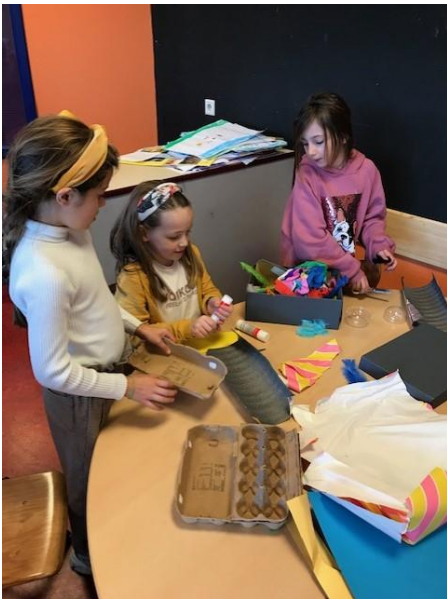
Groep 3 en 4 gaan aan de slag met het thema "Speelgoed".