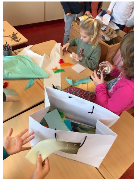
De kinderen van groep 3 en 4 hebben zelf speelgoed gemaakt voor de magische speelgoedmaker. Omdat dit zo goed lukte kregen alle kinderen van de speelgoedmaker een klein speeltje en werden zij benoemd tot echte tovenaarsleerlingen!!