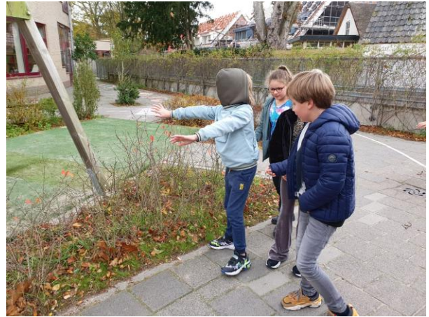
Groep 5 en 6 op 'ontdekking' op het schoolplein....