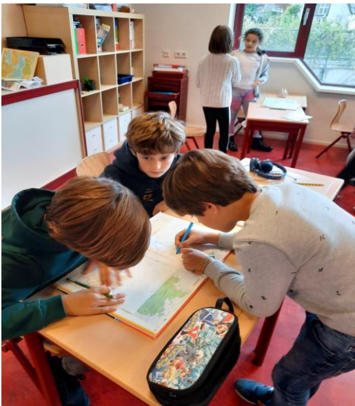
Groep 5 gaat op onderzoek in de atlas

In kleine groepjes mochten de kinderen een kaart uitkiezen en die natekenen. Met alle benodigde gegevens erbij geschreven.