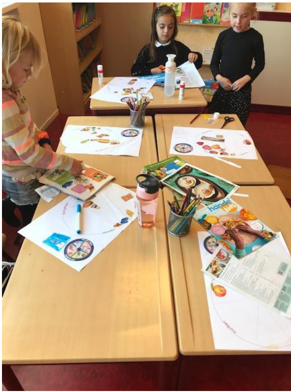
De schijf van vijf

In groep 5 zijn we bezig met vormen van kunst zoals schilderijen, foto's en afbeeldingen. We hebben al prachtige olifanten gekleurd volgens de kleuren van Mondriaan.